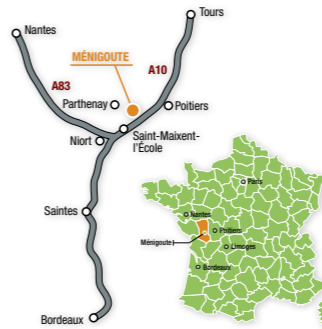
PAO : Tabularasa.fr - Impression Gélani / Parthenay 79 Imprimé sur du papier issu de forêts gérées durablement.